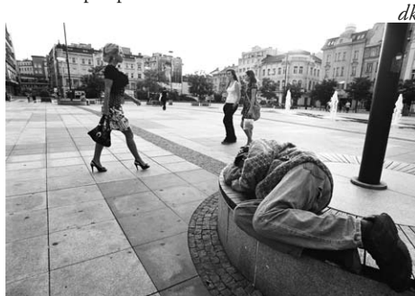
Vítězný snímek fotosoutěže „Jak vypadá chudoba“, autor: Martin Smékal

Charita Ostrava a Armáda spásy provozují za finanční podpory statutárního města Ostrava i Moravskoslezského kraje celoročně sociální služby vedoucí ke zmírnění projevů chudoby u lidí, kteří se ocitli v tíživé životní situaci. Aktivity ke Dnům proti chudobě v Ostravě 2018 finančně podpořilo statutární město Ostrava.